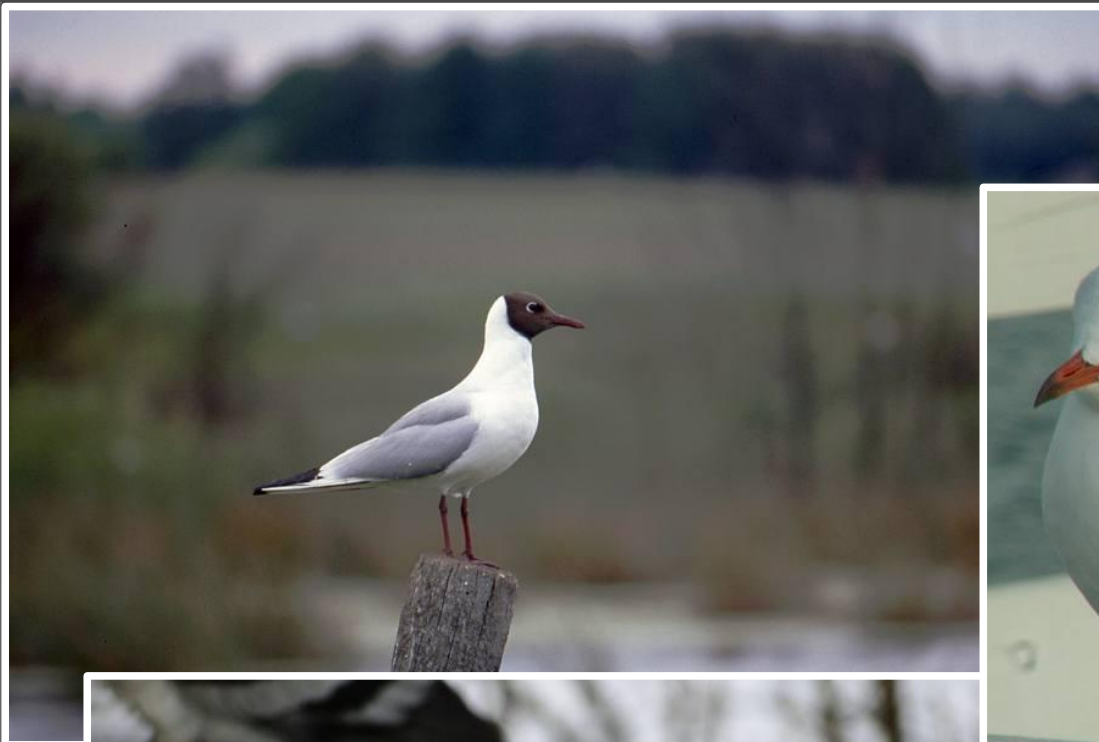
szata godowa (letnia)