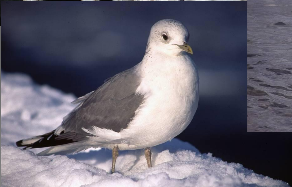
szata spoczynkowa (zimowa)