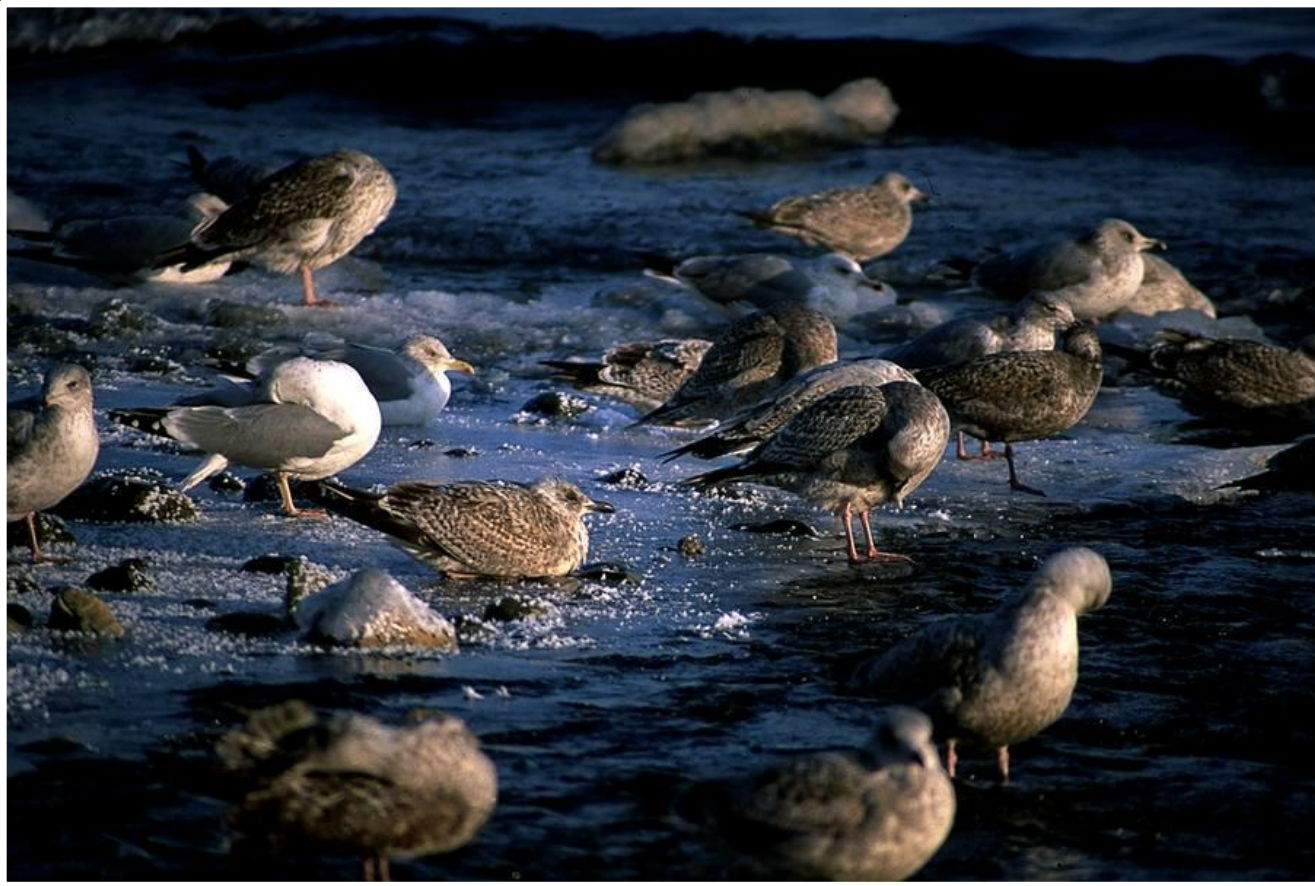
ptaki młode i dwa osobniki dorosłe