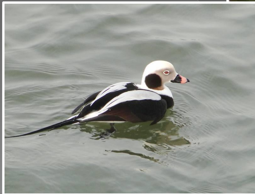
lodówka (samiec zimą)