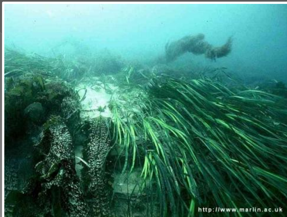
trawa morska (zostera morska)