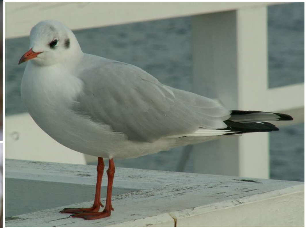
szata spoczynkowa (zimowa)