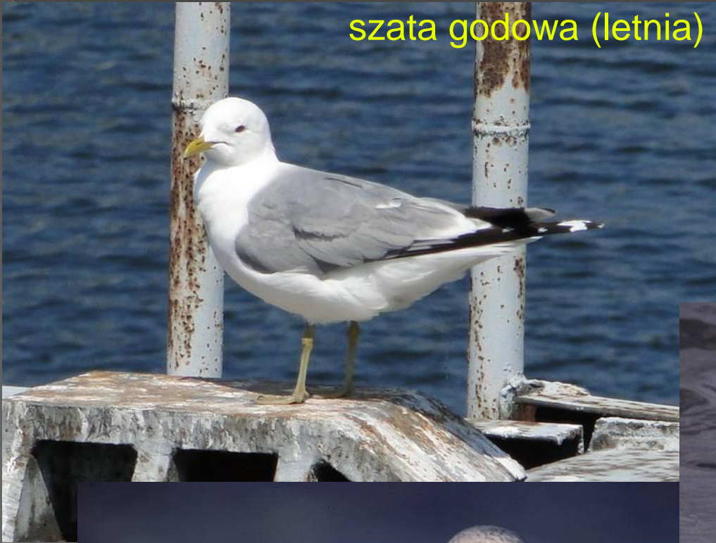
szata godowa (letnia)